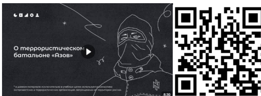
Рисунок 2 – Видеоролик, разъясняющий причины признания организации террористической

3) батальон «Азов» (см. рисунок 2) — военизированное подразделение, созданное в 2014 году на базе футбольных ультрас и праворадикалов Харькова и некоторых других украинских регионов. «Азовцы» причастны к массовым военным преступлениям против мирного населения Донбасса и Украины. Сама организация признана террористической в России по решению Верховного Суда Российской Федерации от 02.08.2022 г. № АКПИ22-411С. Батальон «Азов» входит в состав Национальной гвардии, подчиненной Министерству внутренних дел Украины. С 2014 года боевики батальона «Азов» систематически пытали, убивали и грабили мирных жителей ДНР, ЛНР и востока Украины. У батальона неонацистская идеология. Это проявляется в расизме, русофобии, восхвалении наследия Третьего рейха и украинских коллаборационистов в годы Второй мировой войны. Среди боевиков в том числе распространены радикальные неоязыческие взгляды. Свою идеологию боевики активно распространяют среди украинской молодежи через лагеря подготовки, печатную продукцию (комиксы, книги) и интернет-сообщества. С «Азовом» активно сотрудничает большое количество праворадикальных течений на Украине (признанных в России экстремистскими организациями), например, «Правый сектор», «УНА-УНСО», организация «Тризуб им. Степана Бандеры» и т.д.