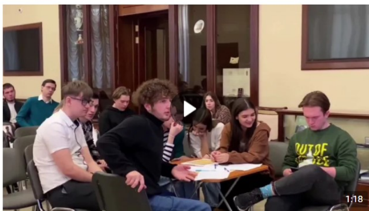
Дебаты «Идеология радикальных организаций» 1 888 просмотров

В рамках дебатов можно: развенчивать мифы, декларируемые представителями радикальных идеологий для вербовки; развивать навыки критического мышления и ведения дискуссии; формировать в целом антитеррористическое сознание и активную гражданскую позицию. Рекомендуется для мероприятия вовлекать не более 20 человек (см. рисунок 5).