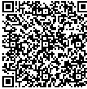
Рисунок 7 — Сценарий тематической викторины с примерами вопросов

В каждом из перечисленных мероприятий важно отслеживать активность участников, высказываемыми ими мнения, их настрой в целом. На таких мероприятиях необходимо присутствие психолога для фиксации активности и оценки их поведения.